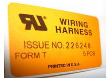
ワイヤリングハーネスラベル例

2009年7月1日からは、ハーネス類のUL証明方法として、これまでの「材料証明書」での証明はできなくなり、ワイヤリングハーネス登録工場で製造された事を証明する「ワイヤリングハーネスラベル」でのみUL証明が可能となります。当社は、1997年にワイヤリングハーネスの登録工場として認定され、10年以上の実績があります。